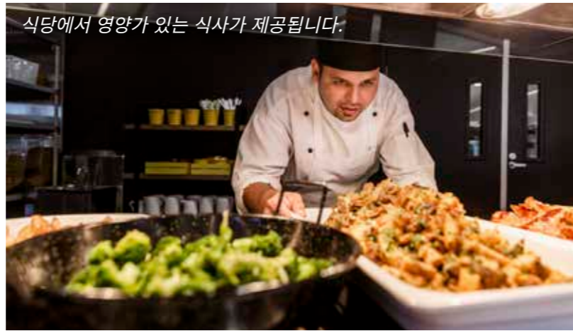
식당에서 영양가 있는 식사가 제공됩니다.