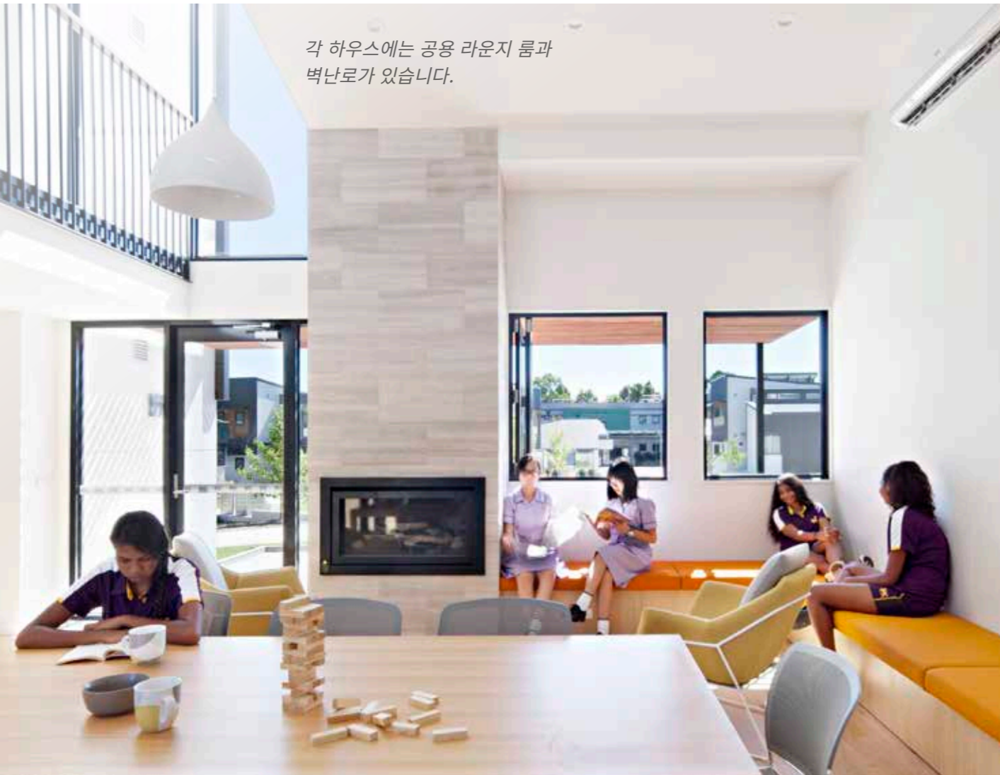
각 하우스에는 공용 라운지 룸과 벽난로가 있습니다.