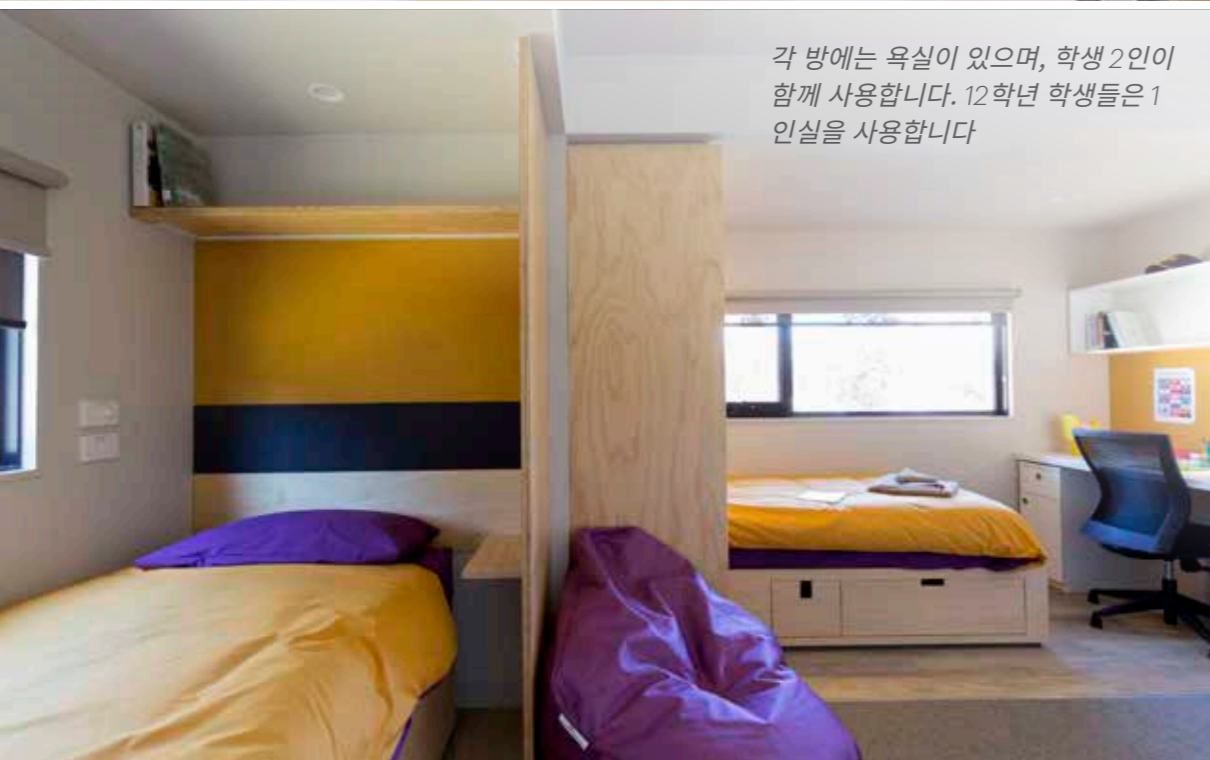
각 방에는 욕실이 있으며, 학생 2인이 함께 사용합니다. 12학년 학생들은 1인실을 사용합니다

학생들은 아침, 점심, 저녁을 위한 공용 식당 공간을 이용할 수 있습니다. 식당은 240명을 수용하며 여가 공간과 이어져 있습니다. 신선하고 맛있고 영양가 있는 음식이 항상 메뉴로 제공됩니다.